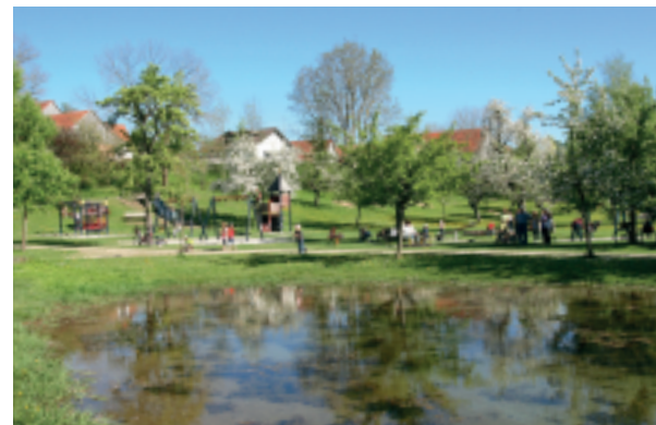
Der Spielplatz im Forstgarten: der schönste Spielplatz in ganz Oberbayern