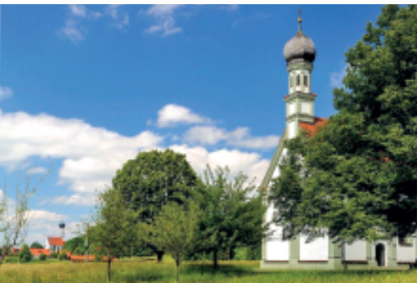
Die wunderbare Kapelle St. Leonhard