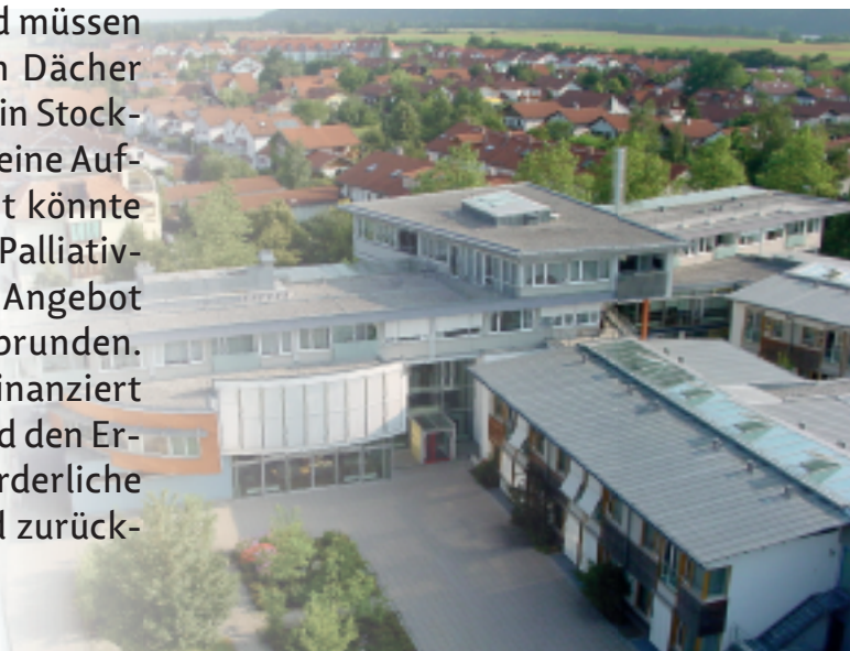
Seniorenstift Kaufering: Der Komplex rechts im Bild soll aufgestockt werden