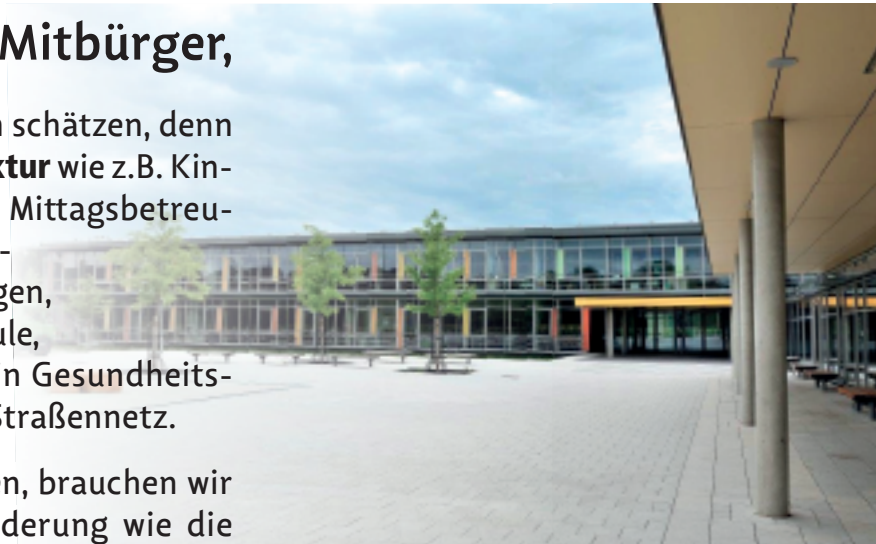
Durch eine stimmige Standortplanung ist es gelungen, die neue Realschule des Landkreises zu uns nach Kaufering zu holen.

Nachstehend beschreiben wir deshalb investive Maßnahmen im Rahmen einer behutsamen Weiterentwicklung , zu der wir uns als „Kauferinger Mitte“ bekennen und deren Finanzierungsmöglichkeiten wir skizzieren. Zur besseren Übersicht haben wir nach Themenblöcken geordnet, was aber bedingt, dass aus der Reihenfolge noch nicht auf die Dringlichkeit geschlossen werden kann.