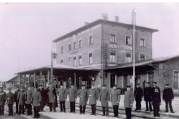
Das Bahnhofsgebäude Kaufering, inzwischen 141 Jahre alt und immer noch in Betrieb. Das ursprünglich sichtbare Klinkermauerwerk ist verputzt worden. Die Zahl der Beschäftigten hat sich auf Sieben verringert

Ebenfalls vom Abbruch bedroht ist der sogenannte „ Schmittsbauerhof “ in Kaufering-Dorf. Als Ortsbild prägend haben wir ihn gekauft, und Ortsbild prägend soll er auch bleiben. Eine Sanierung zu Wohnzwecken wird finanziell nicht darstellbar und wegen der dann erforderlichen Eingriffe in die bisher ungestörten Dachflächen auch nicht wünschenswert sein. Stattdessen würde zu seinem würdigen Alter passen, ihn zur Aufbewahrung von Exponaten zu nutzen, die mit der Geschichte von Kaufering verbunden sind. Denkbar wären Sammlungsstücke zu Themenbereichen wie z.B. Kirchen und Kapellen, der (unverbaute) Lech, der Bau der Eisenbahn, die Kriegszeit, die Not nach den Kriegen, die Aufnahme der Heimatvertriebenen, das bäuerliche Leben, der Lechraindialekt und vieles andere mehr.