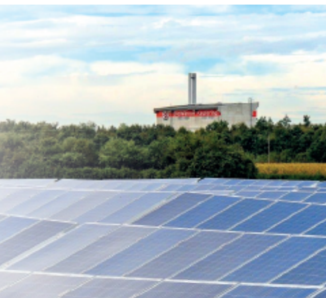
Vorne die Freiflächen-Photovoltaikanlage Mahdau, im Hintergrund die Biomasse-Kraft-Wärme-Anlage