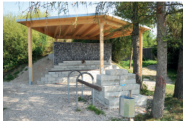
Unterstand als Wetterschutz in zentraler Lage für Jugendliche - und Lärm geschützt

Unser Rathaus ist nach den kirchlichen Gebäuden ein für Kaufering markanter Bau, dessen bereits angedachter Verkauf bzw. Abriss sich verbietet. Seit Jahren schon ist das Erdgeschoss über eine Rampe barrierefrei zu erreichen. Nun sollen über einen an der Nordseite angebauten Aufzug auch das Untergeschoss und der 1. Stock barrierefrei erreichbar sein. Mit gut angelegten Kosten in Höhe von rd. 175.000 € ist zu rechnen. Bevor aber ganze Abteilungen ausgelagert werden, sollten zuerst die baulichen Möglichkeiten im Souterrain kostengünstig genutzt und/oder alte Akten, die nur aufgehoben werden müssen, anderswo untergebracht werden.