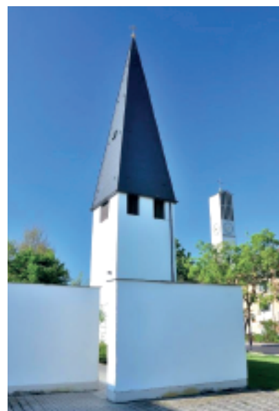
Der Turm der evangelischen Pauluskirche (mit dem Turm von Maria Himmelfahrt im Hintergrund)