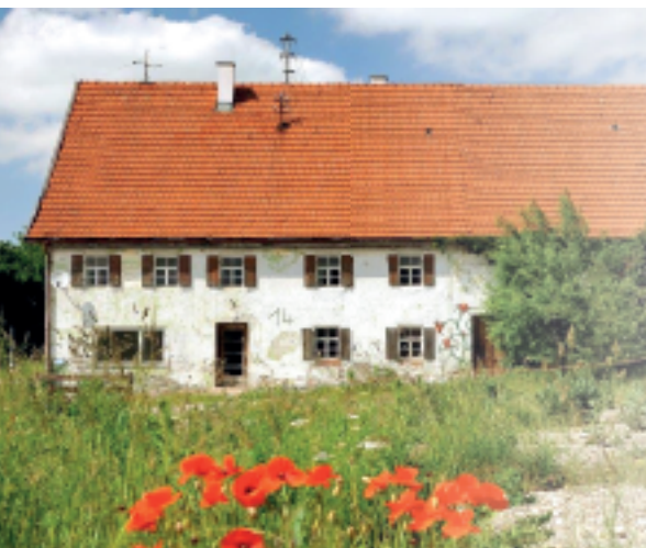
Der „Schmittsbauerhof“, in seinem jetzigen, aber sanierungswürdigen Zustand