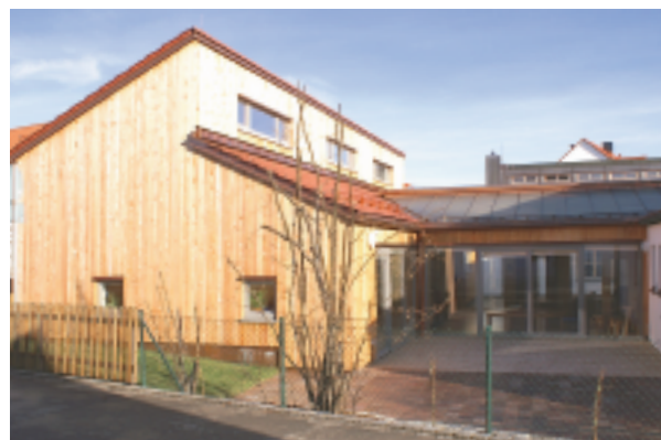
Die baulich ergänzte Kinderkrippe in der Kindertagesstätte „Paul und Paulinchen“ der evangelischen Kirchengemeinde.