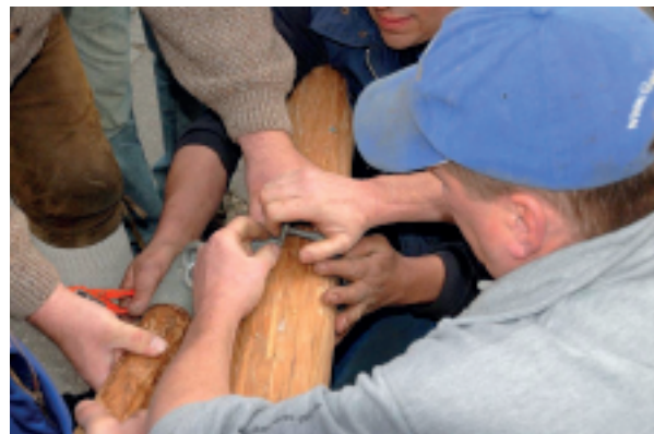
Ein Problem lässt sich leichter lösen, wenn alle Hand mit anlegen

Im Bereich der Kindertagesstätten müssen wir darauf achten, dass, nachdem wir baulich versorgt sind, in Kaufering mindestens eine Gruppe ab 6:00 Uhr und mindestens eine Gruppe bis 18:00 Uhr geöffnet hat: Eine warum auch immer erforderliche oder gewünschte Berufstätigkeit der Eltern darf nicht an den Öffnungszeiten scheitern! Schließzeiten in den Ferien müssen familiengerecht sein.