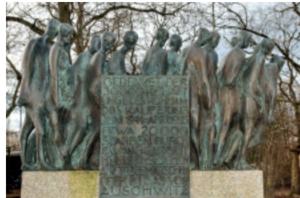
Das KZ-Mahnmal Kaufering, gestaltet von Professor Hubertus von Pilgrim und gestiftet von Dr. Friedrich Schreiber

Dieses „Wissen“ schließt aber auch mit ein, dass wir weder vergessen, dass der Name „Kaufering“ in das dunkelste Kapitel deutscher Geschichte eingebunden ist, noch dass es die vielen Heimatvertriebenen waren, die nach dem Krieg durch immensen Fleiß und partnerschaftlichen Zusammenhalt die Basis für das heutige Kaufering geschaffen haben.