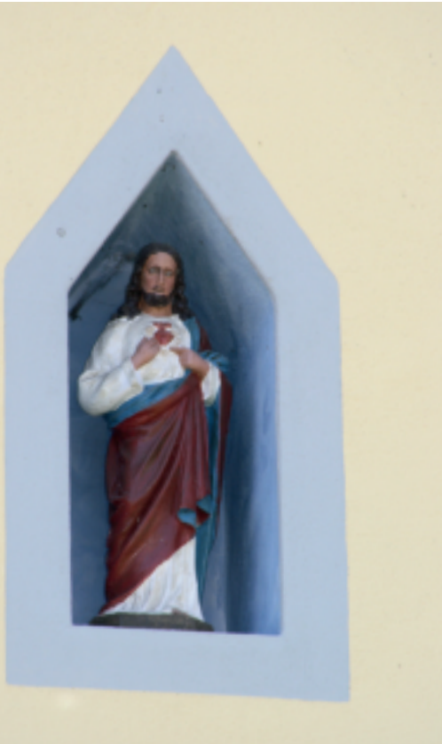
Jesus-Statue am Anwesen „Dalmer“ Leonhardstraße 36

Das Thema „ Schulden “ lässt sich offensichtlich so zurechtbiegen, wie es die jeweilige Situation erfordert; dieses Thema ist wie ein Fass ohne Boden. Aber auch „Hochkarräter“ müssen aufpassen, was sie so von sich geben: Wenn z.B. der angesehene Bayerische Kommunale Prüfungsverband jetzt ohne weiteren Kommentar rein zahlenmäßig moniert, dass die Schulden bei den Kommunalwerken im Prüfungszeitraum von 2009 bis 2012 um 14 Mio € angestiegen sind, dann verkennt er in Gänze, dass für diese 14 Mio € zwei riesige Photovoltaikanlagen entstanden sind, die nach Abzug aller Kosten (rein netto) rd. 500.000 € pro Jahr erwirtschaften.