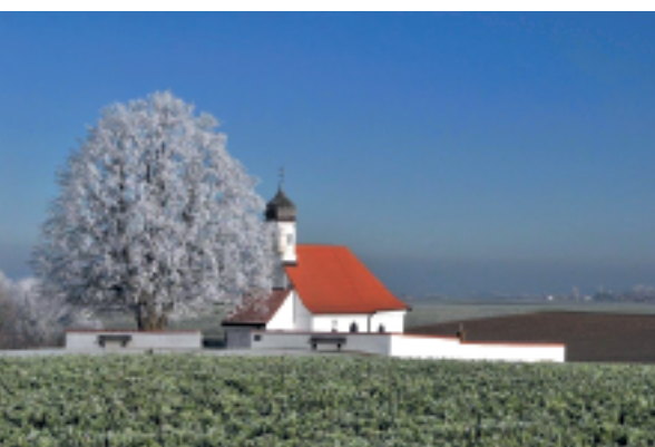
Die Pestkapelle St. Walburga, das älteste Gebäude in Kaufering, lässt sich zu allen Jahreszeiten fotogen ablichten. Die schief stehende Umfassungsmauer wird von Hightech-Stahleinlagen der Fa. Hilti gehalten.

Weiter geführt werden muss die Planung für eine Umfahrung von Kaufering im Südosten - von der B17alt bis zum Viehweideweg . Es besteht derzeit noch keine Dringlichkeit, diese Straße zu bauen. Mittelfristig aber wird sie eine Stütze im Kauferinger Straßennetz sein.