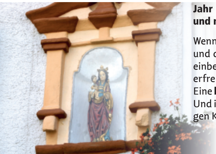
Marien-Statue am Anwesen „Scherbauer“ Brückenring 12

Eine behutsame Weiterentwicklung ist also finanzierbar. Und in einer sinnvoll nachhaltigen Weiterentwicklung liegen Kauferings künftige Chancen!