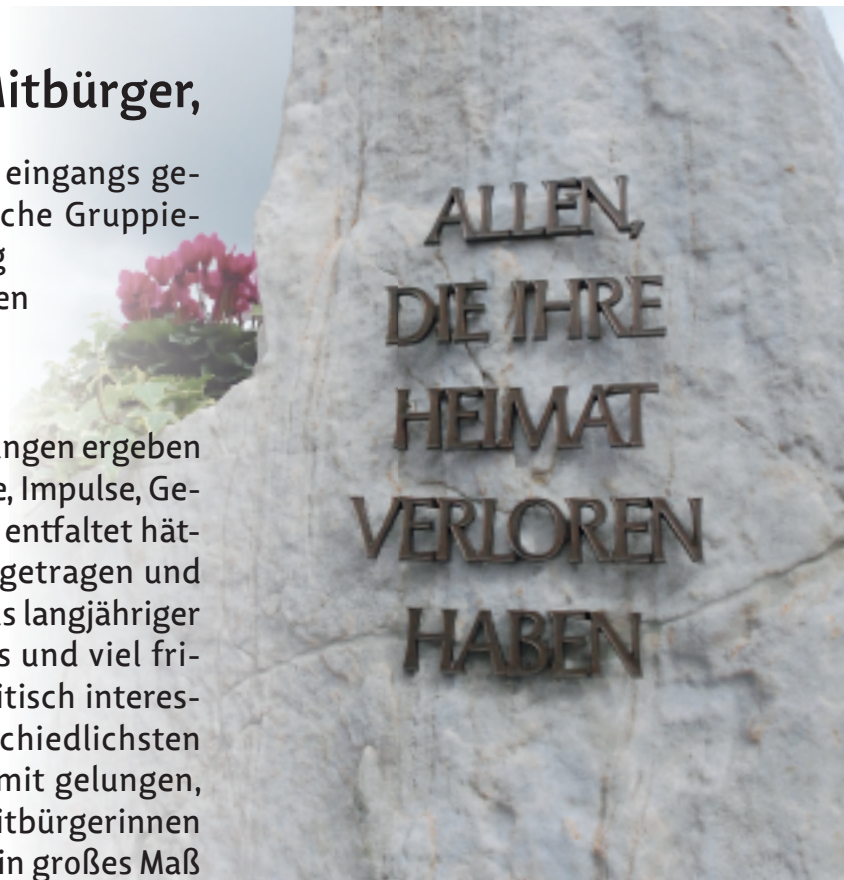
Gedenkstein, der an das Schicksal der Heimatvertriebenen erinnert

Durch Zusammenschlüsse und Neugliederungen ergeben sich immer wieder neue und wertvolle Kräfte, Impulse, Gedanken und Ideen, die sich ansonsten nicht entfaltet hätten. Zudem wird unser Zusammenschluss getragen und beflügelt von einer gelungenen Mischung aus langjähriger kommunalpolitischer Erfahrung einerseits und viel frischem Wind durch die Einbindung von politisch interessierten Neueinsteigern aus den unterschiedlichsten Berufszweigen andererseits. Es ist uns damit gelungen, Ihnen ein Team aus vertrauenswürdigen Mitbürgerinnen und Mitbürgern zusammen zu stellen, die ein großes Maß an Lebenserfahrung aufweisen und die mit beiden Beinen auf dem Boden der Tatsachen stehen.