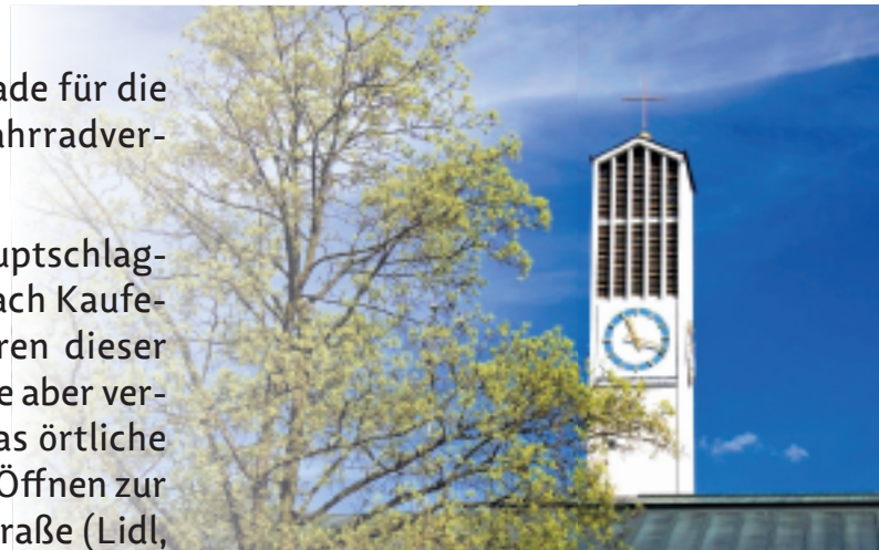
Der Kirchturm der Pfarrkirche Maria Himmelfahrt, von Süden aus fotografiert