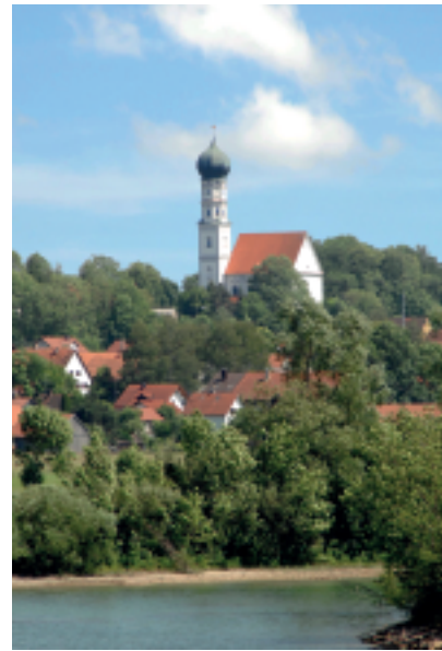
Die Pfarrkirche St. Johannes Baptist, von Nord-Westen aus fotografiert. Ganz oben im Westgiebel steht seit Leonhardi 2012 die Statue „Jesus Chritus, der Gute Hirte“

Nicht vergessen werden darf die Lösung der unbefriedigenden Parkplatzsituation im Bereich nördlich des Seniorenstiftes und des Ärztehauses (Gesundheitszentrum). Hier soll durch die Anlage von Parkplätzen zwischen den Bäumen der Gegenverkehr wieder ermöglicht werden. Zusammen mit der baulichen Fertigstellung der Verkehrsflächen am Fuggerplatz sind rd. 70.000 € anzusetzen.