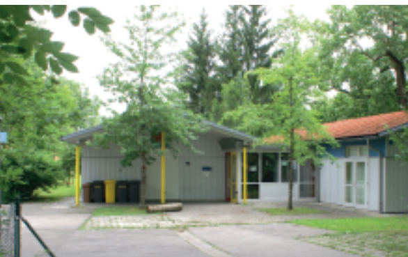
Das Jugendhaus OVAL, dessen östliche Hälfte inzwischen an den Schützenverein Enzian .e.V. vertauscht worden ist

Einige der eingangs genannten Anlagen sind inzwischen „in die Jahre“ gekommen und müssen „aufgefrischt“ werden. Vorrang haben Anlagen, bei denen die verschärften Bestimmungen des Brandschutzes nachgewiesen werden müssen, wie z.B. bei der großen Sporthalle . Sie soll auch energetisch nachgerüstet werden. Bei einer verantwortlichen Verbesserung der Energieeffizienz (z.B. durch „Wärmedämmung“) ist aber immer der Nachweis zu führen, dass es sich auch um eine wirtschaftlich rentable Maßnahme handelt.