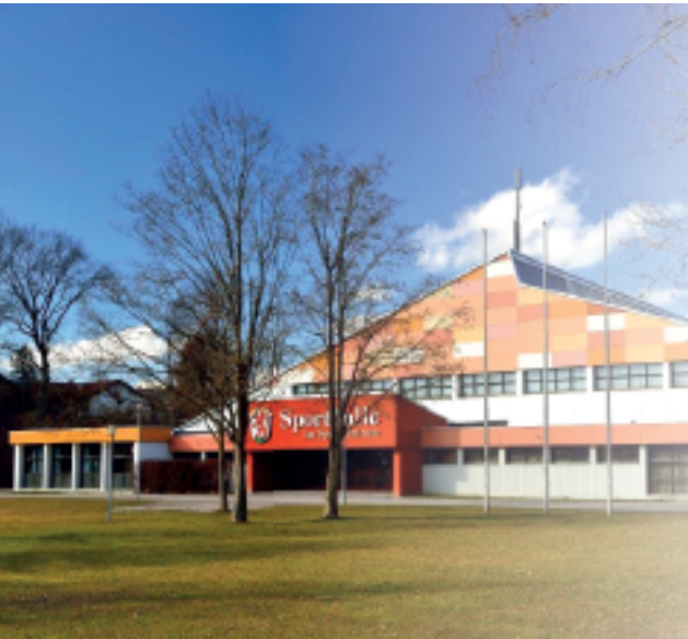
Die 3-fach-Sporthalle, das Flaggschiff unseres Sportareals an der Bayernstraße