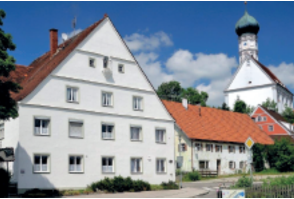
Der „Schmittsbauerhof“, Ortsbild prägend und eingebettet in das Ensemble „Brühwirt / Oberer Wirt“