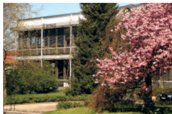
Das Rathaus Kaufering: Baujahr 1970, aber immer noch Klasse!